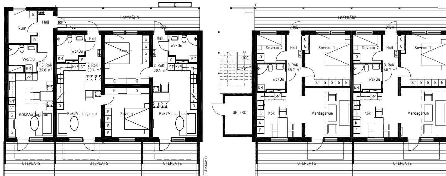
PLAN 1 hus A - Åkerholmsgatan 10A-F