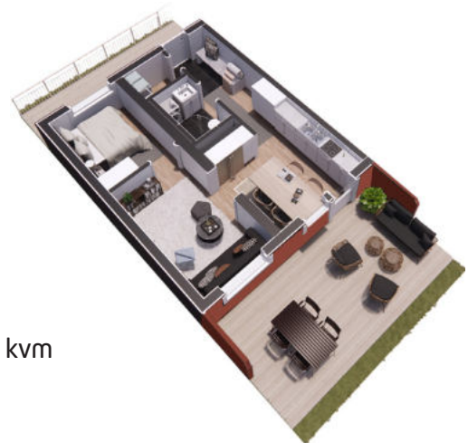
2 rum och kök om 54 kvm