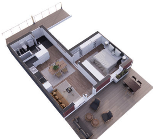
2 rum och kök om 40 kvm