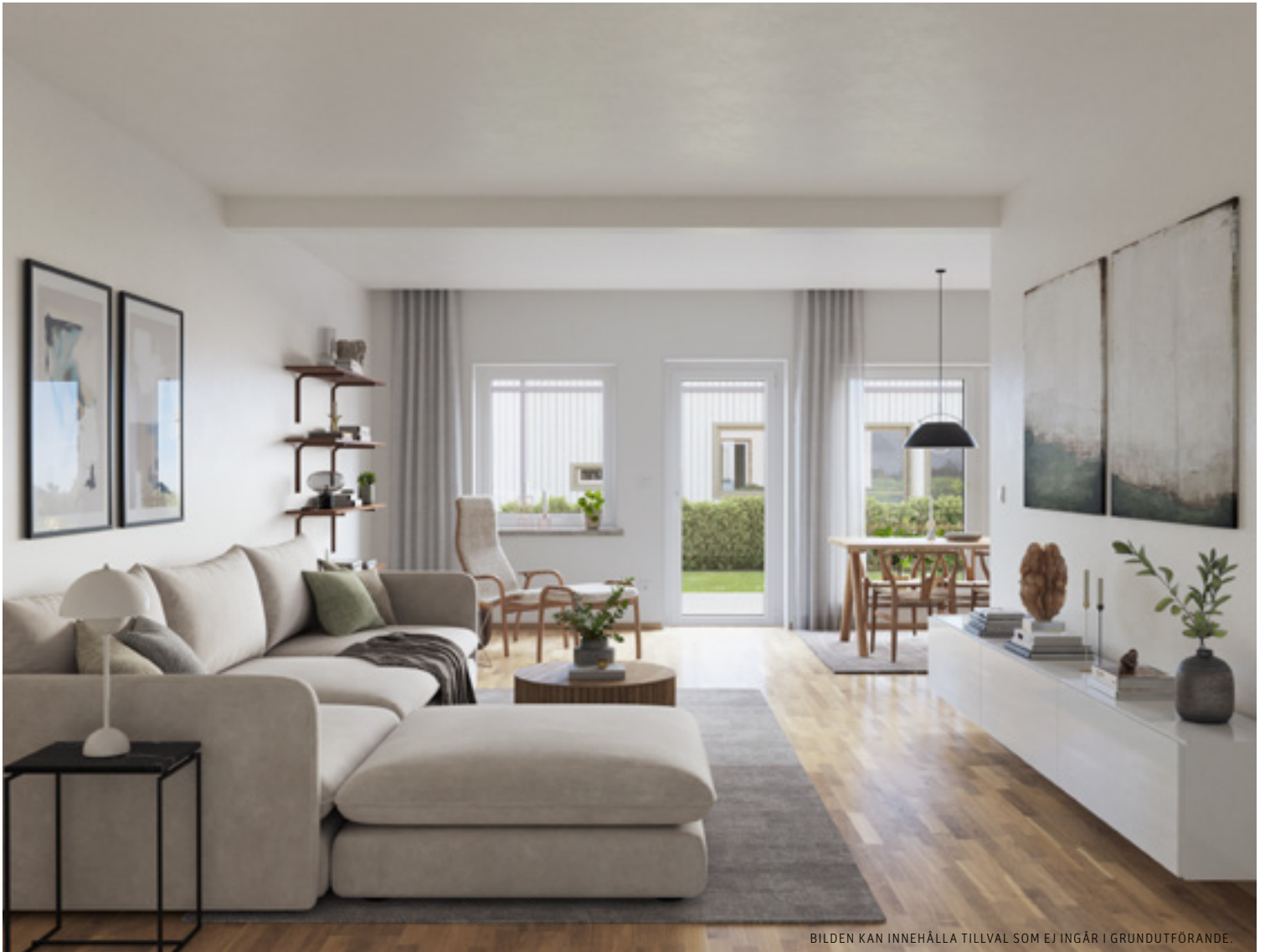
BILDEN KAN INNEHÅLLA TILLVAL SOM EJ INGÅR I GRUNDUTFÖRANDE.