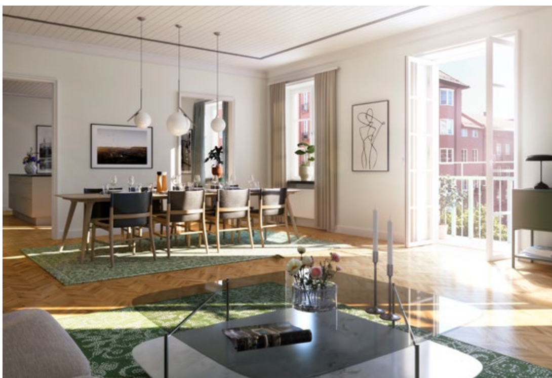
Lägenhet 233, Polismästarens bostad, i gamla polishusets A del.