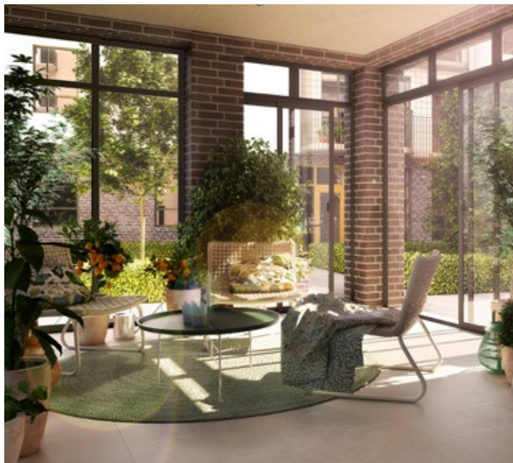
Gemensambetslokal för alla boende.