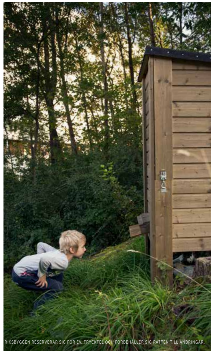
RIKSBYGGEN RESERVERAR SIG FÖR EV. TRYCKFEL OCH FÖRBEHÅLLER SIG RÄTTEN TILL ÄNDRINGAR.