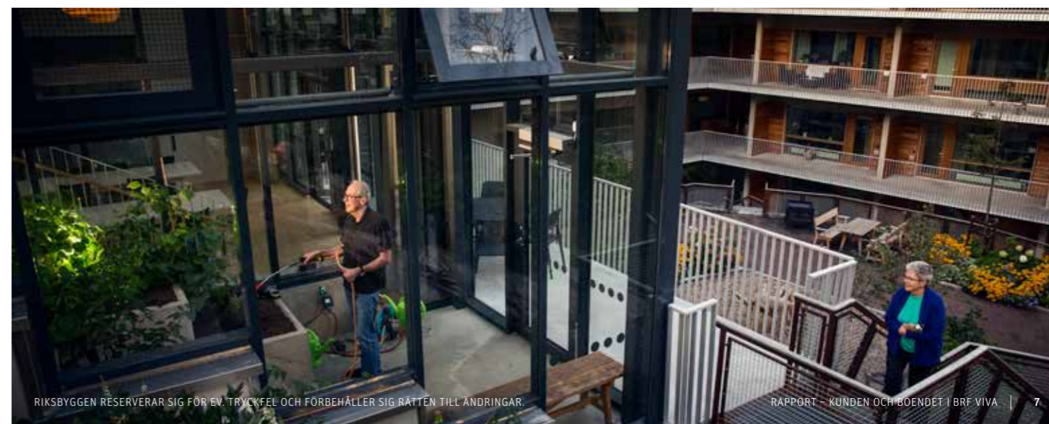
RIKSBYGGEN RESERVERAR SIG FÖR EV. TRYCKFEL OCH FÖRBEHÅLLER SIG RÄTTEN TILL ÄNDRINGAR.