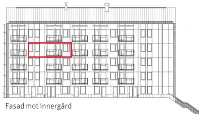
Fasad mot innergård