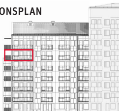
Fasad mot innergård