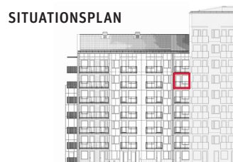
Fasad mot innergård